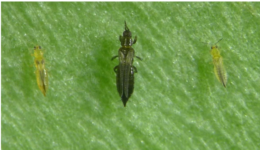
Figura 1.- Aspecto de las hembras de las dos especies de trips más dañinas en los cítricos de la Comunidad Valenciana y la especie de nueva introducción Scirtothrips aurantii .