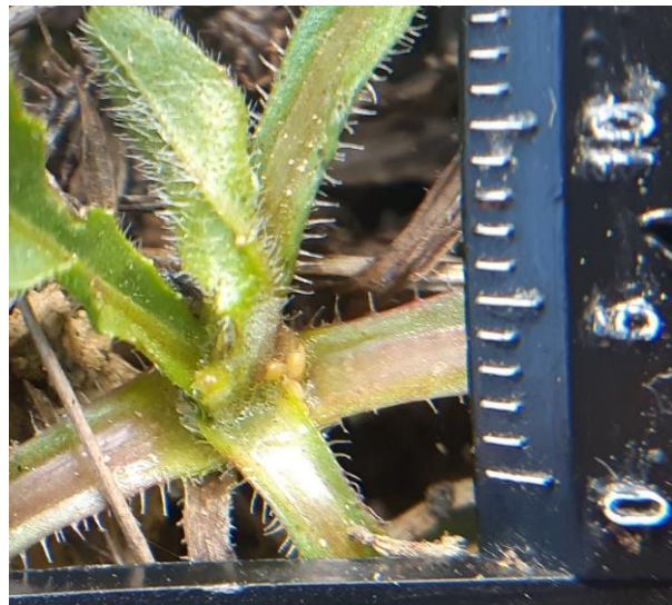
Ninfas y espumas de tipo A